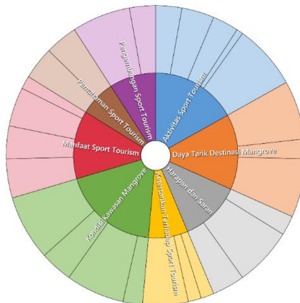
Gambar 3. Sunburst Chart

Selanjutnya, untuk melihat hubungan hierarkis antara tema dan subtema, dilakukan visualisasi struktur tematik hasil analisis kualitatif.