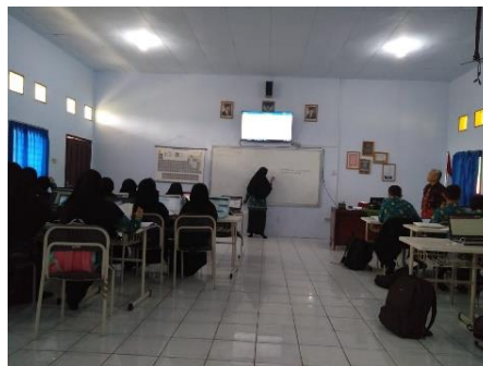
Gambar 5 Siswa Menjadi Lebih Aktif dan Mandiri dalam Kegiatan Belajar Mengajar (KBM) melalui Pembelajaran E-learning

Pernyataan informan HH dan AZ di atas didukung oleh catatan lapangan yang diperoleh peneliti saat melakukan penelitian. Di lokasi penelitian, peneliti mengamati bahwa pelaksanaan pembelajaran e-learning pada siswa membuat siswa lebih aktif dalam mengeksplor ilmu pengetahuan, selain itu, semangat belajar siswa pun meningkat karena konten pembelajaran tidak monoton hanya berbentuk buku saja. Hal ini dapat dilihat pada gambar 5 berikut: