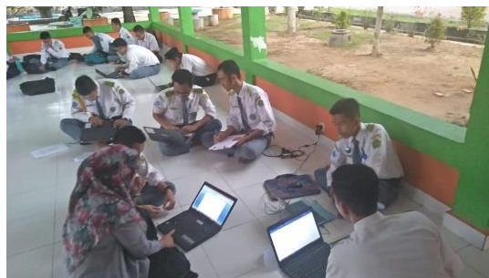
Gambar 4 Siswa MAN Insan Cendekia Jambi Menggunakan Fasilitas Wi-Fi di CSA (Central Student Activity)

Fasilitas-fasilitas pendukung pembelajaran e-learning seperti Wi-Fi dan laptop, sudah sangat maksimal penerapannya di MAN Insan Cendekia Jambi. Hal ini bertujuan untuk mengembangkan dan mengoptimalkan pembelajaran e-learning pada siswa. Keterangan di atas diperkuat dengan dokumentasi penelitian yang dapat dilihat pada gambar 4 berikut: