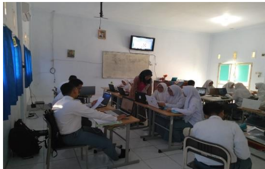
Gambar 6. Pembelajaran E-learning Mempengaruhi Kesiapan Siswa di MAN Insan Cendekia Jambi dalam Menghadapi Era Revolusi 4.0

Pernyataan dari informan HS dan SF ini sejalan dengan catatan lapangan yang diperoleh peneliti saat melakukan penelitian. Di lokasi penelitian, peneliti mengamati bahwa e-learning sangat mempengaruhi kesiapan siswa di MAN Insan Cendekia Jambi dalam menghadapi era revolusi 4.0. Hal ini dapat dilihat dari perkembangan teknologi pembelajaran yang semakin canggih dan kondusif untuk mendukung proses pembelajaran siswa di MAN Insan Cendekia Jambi, yang dapat mempengaruhi kesiapan siswa dalam menghadapi era revolusi 4.0. Hal tersebut dapat dilihat pada gambar 6 berikut: