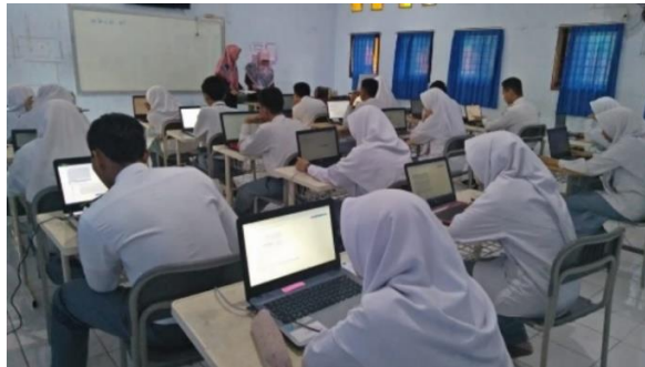
Gambar 3 Penggunaan Fitur dalam Pembelajaran E-learning

Penyataan di atas sesuai dengan pernyataan dari Michael, bahwa E-learning adalah pembelajaran yang disusun dengan tujuan menggunakan sistem elektronik atau komputer sehingga mampu mendukung proses pembelajaran. Keterangan di atas diperkuat dengan dokumentasi penelitian yang dapat dilihat pada gambar 3 berikut: