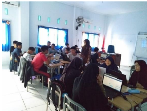
Gambar 2 Penggunaan Laptop dalam Proses Pembelajaran Siswa

Berbagai keterangan di atas dikuatkan oleh catatan lapangan yang diperoleh oleh peneliti saat melakukan penelitian, di mana peneliti menemukan bahwa guru di MAN Insan Cendekia Jambi telah mendapatkan sosialisasi tentang penggunaan dan penerapan e-learning , serta sudah menerapkan pembelajaran e-learning kepada siswa di MAN Insan Cendekia Jambi. Sedangkan bagi siswa, siswa selalu membawa dan menggunakan laptop dalam pembelajaran sehari-hari sebagai bentuk penerapan pembelajaran e-learning . Hal tersebut dapat dilihat pada gambar 2 berikut: